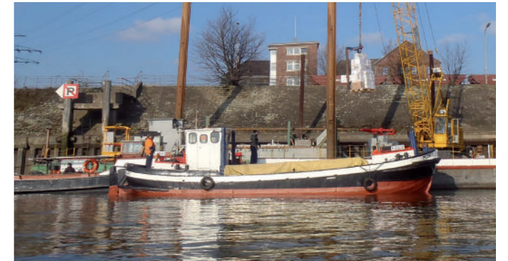
Nebenerwerb: Nachschubversorgung mit der „Moni“